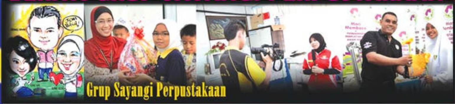
Grup Sayangi Perpustakaan