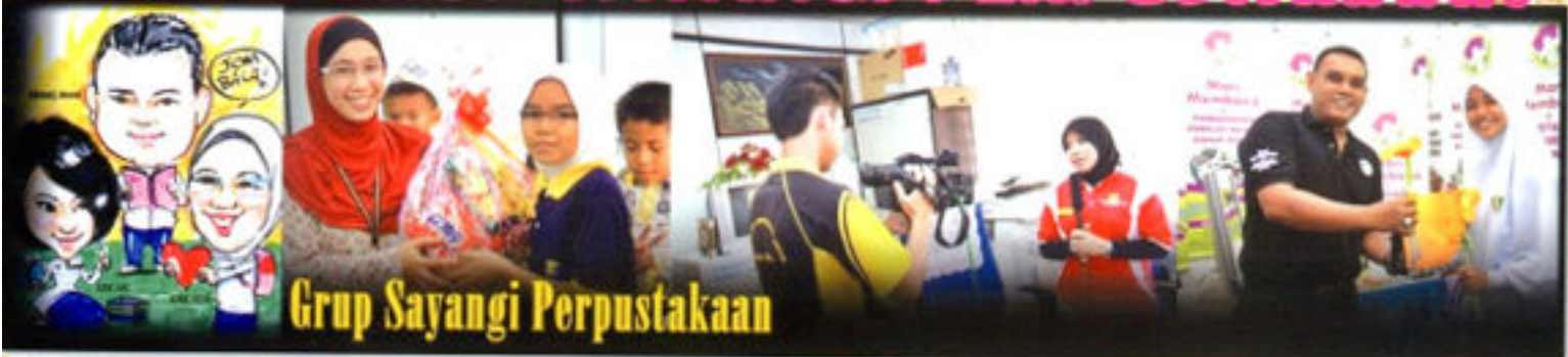
Grup Sayangi Perpustakaan

Seramai 743 pelajar sekolah telah menyertai Program Sayangi Perpustakaan iaitu Sekolah Kebangsaan Guduk, Gemenchek, 19 Jun 2014, Sekolah Menengah Kebangsaan Undang Jelebu, 23 Jun 2014 dan Sekolah Kebangsaan Dato' Abdullah, Gemenchek, 24 Jun 2014. Seperti di sekolah-sekolah lain sambutan terhadap Grup Sayangi Perpustakaan amatlah mengembirakan hati kami semua. Pelbagai aktiviti menarik yang telah disediakan untuk pelajar sekolah seperti kuiz, Jom Membaca, bijak matematik, berkreaitif dan yang paling menyeronok bagi pelajar sekolah ialah persembahan Boneka "Mari Bersama Chot". Kepada para guru besar, guru-guru dan pelajar sekolah, diucapkan ribuan terima kasih.