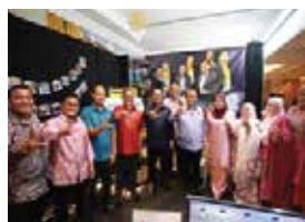
4 NOVEMBER 2025 MAJLIS APRESIASI INOVASI PERINGKAT NEGERI SEMBILAN TAHUN 2025 DI ROYALE CHULAN, SEREMBAN