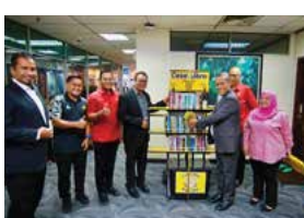
10 DISEMBER 2025 PENYERAHAN RUMAH BUKU (CASA LIBRO) DI PEJABAT MENTERI BESAR NEGERI SEMBILAN