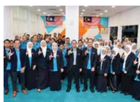
24 NOVEMBER 2025 PERHIMPUNAN WARGA KERJA BIL. 2/2025 DAN MAJLIS IKRAR BEBAS RASUAH WARGA KERJA PPANS DI PERPUSTAKAAN NEGERI, SEREMBAN 2