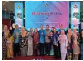
25 SEPTEMBER 2025 MAJLIS PERASMIAN PESTA BUKU MELAKA 2025 DI THE SHORE SHOPPING GALLERY, MELAKA