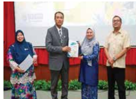
10 SEPTEMBER 2025 MAJLIS PENUTUPAN RASMI PROGRAM MELEWAR INFORMATION LITERACY CHALLENGE (MILC) 2025 DI IPGKRM KAMPUS RAJA MELEWAR, SIKAMAT