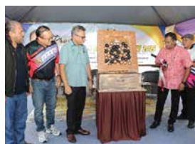
6 DISEMBER 2025 PROGRAM SENTUHAN KOMUNITI BESTARI 2025 DI PERPUSTAKAAN DESA TAMAN INTAN PERDANA, PORT DICKSON