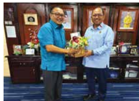
21 OKTOBER 2025 KUNJUNGAN HORMAT PPANS KEPADA YB SETIAUSAHA KERAJAAN NEGERI SEMBILAN DI WISMA NEGERI, SEREMBAN