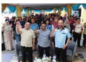
12 NOVEMBER 2025 PROGRAM MEMADANIKAN PERPUSTAKAAN, MELESTARIKAN PERPADUAN DI PERPUSTAKAAN AWAM PORT DICKSON