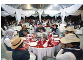
30 NOVEMBER 2025 MAJLIS MAKAN MALAM PENGHARGAAN PPANS DI EAGLE RANCH RESORT, PORT DICKSON