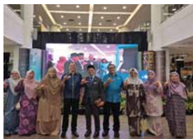
30 SEPTEMBER 2025 MAJLIS PERASMIAN PESTA BUKU SARAWAK 2025 DI THE HILLS, KUCHING