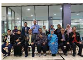
5 NOVEMBER 2025 MESYUARAT PENUTUP PENGAUDITAN PENYATA KEWANGAN PPANS DI PERPUSTAKAAN NEGERI, SEREMBAN 2