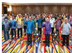
30 OKTOBER 2025 MAJLIS PERASMIAN SEMINAR MEMARTABATKAN KOLEKSI TEMPATAN: MEMBANGUN PEMULIHARAAN, AKSES DAN MASA DEPAN DI ARENA PREMIER HOTEL, SEREMBAN