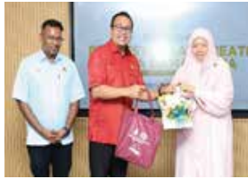
23 SEPTEMBER 2025 LAWATAN PENANDAARASAN PEMBANGUNAN PERPUSTAKAAN KOMUNITI KE PERBADANAN PERPUSTAKAAN AWAM SELANGOR