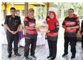
22 OKTOBER 2025 PERTANDINGAN EXPLORACE PERKHIDMATAN AWAM SEMPENA MINGGU INOVASI PERINGKAT NEGERI SEMBILAN TAHUN 2025 DI DAERAH JELEBU