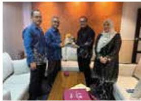
4 SEPTEMBER 2025 KUNJUNGAN HORMAT PENGARAH PPANS KE PEJABAT KEWANGAN NEGERI, NEGERI SEMBILAN