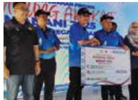
20 DISEMBER 2025 MAJLIS PENYERAHAN PROJEK KAMPUNG ANGKAT MADANI DI PENGKALAN NELAYAN KAMPUNG SUNGAI TIMUN, TEMBAU