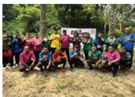
1 NOVEMBER 2025 HARI SUKAN NEGARA PERBADANAN PERPUSTAKAAN AWAM NEGERI SEMBILAN 2025 DI MARSHA AND THE BEARLAND OF LAUGHTER PEDAS, REMBAU