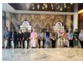
9 NOVEMBER 2025 MESYUARAT MAJLIS PENGARAH-PENGARAH PERPUSTAKAAN AWAM SE-MALAYSIA (MPAM) BIL. 3/2025 DI IMPIANA HOTEL, IPOH, PERAK